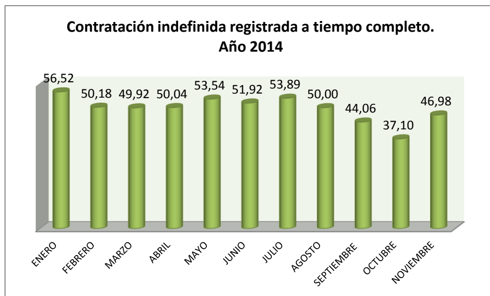
Gráfico 1: Evolución contratación indefinida a tiempo completo.

Fte: Sepe. Contratación. Últimos datos publicados por CCAA.