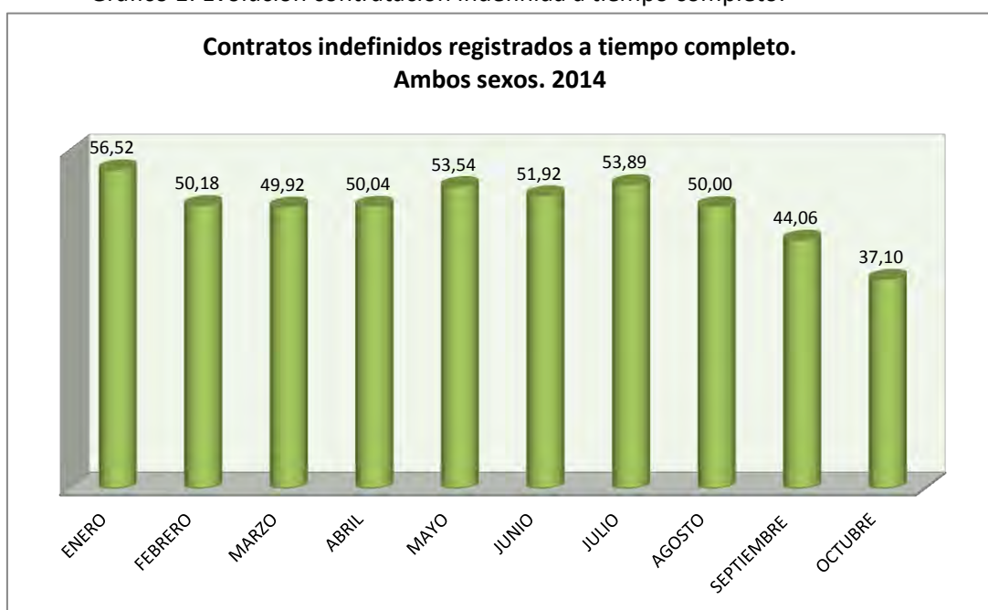
Gráfico 1: Evolución contratación indefinida a tiempo completo.