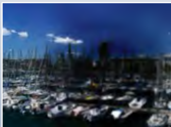
Visión ojo afectado.